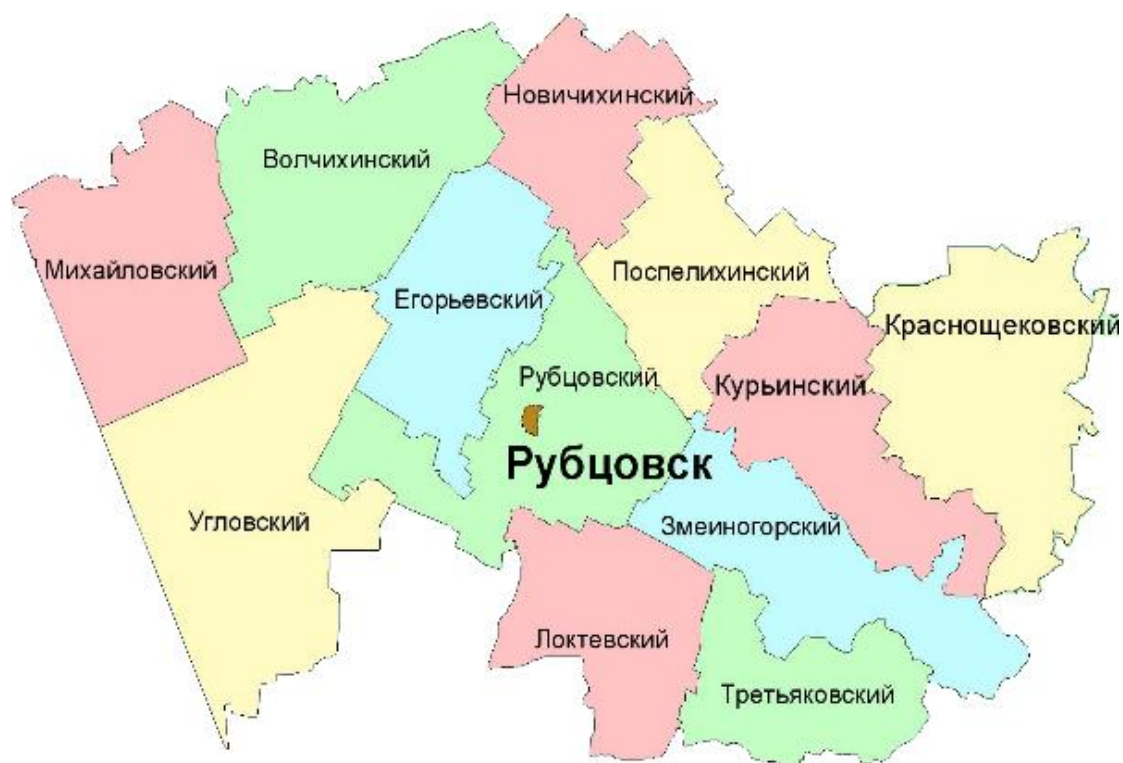
Рис. 1. Административно-территориальные единицы, входящие в состав Рубцовского управленческого округа

За РИИ АлтГТУ закреплён Рубцовский управленческий округ, который включает 13 административно-территориальных единиц: Волчихинский район, Егорьевский район, Змеиногорский район, Краснощековский район, Курьинский район, Локтевский район, Михайловский район, Новичихинский район, Поспелихинский район, Рубцовский район, Третьяковский район, Угловский район и город Рубцовск.